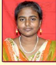
G. Mispha 15MAE27

எங்கள் தமிழ்மொழி ! எங்கும் தமிழ்மொழி ! என்றும் தமிழ்மொழியே ! நாட்டின் விளக்கே! எங்கள் தமிழ்மொழியே ! பாரெங்கும் பரவும் மொழியே! பாக்கியம் தந்த மொழியே!