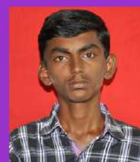
KOTTAIYAPPAN@MUTHU. S JOINT SECRETARY Shift - II